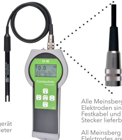
Leitfähigkeits-Messgerät mit Stoßschutz Conductivity Meter with protective cover

Alle Meinsberger Elektroden sind mit Festkabel und BK-Stecker lieferbar.