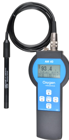
Sauerstoff-Messgerät Oxygen Meter